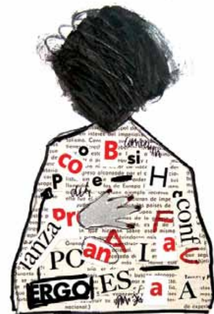
Obra: José Miguel Rojas